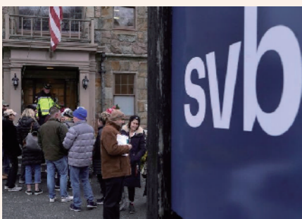
一名执法官员正在监控美国硅谷银行分行外的排队情况。

3月10日,美国硅谷银行倒闭,成为2008年国际金融危机以来美国发生的最大宗银行倒闭事件。不久后,美国政府宣布关闭签名银行。3天内两家银行倒闭,一度导致美国银行业惨遭投资者抛弃,股价大幅下挫。