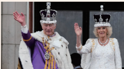
英国国王查尔斯三世与王后卡米拉在加冕仪式后在白金汉宫的阳台上挥手致意。

当地时间5月6日,英国国王查尔斯三世的加冕典礼在伦敦威斯敏斯特教堂举行。查尔斯国王成为自1066年以来第40位英国君主。