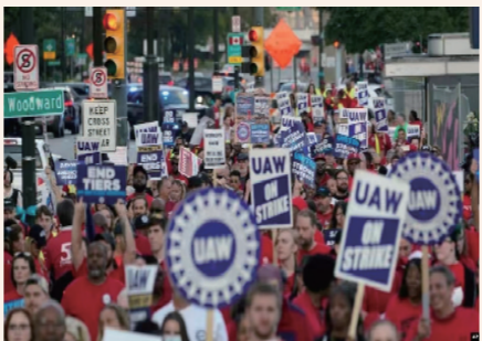
全美汽车工人联合会(UAW)针对三大汽车制造商同步发动大罢工。