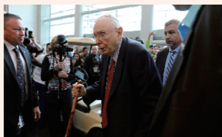
2019年5月,查理·芒格参加伯克希尔年度股东大会。

当地时间11月28日,美国知名投资人、伯克希尔-哈撒韦公司董事会副主席查理·芒格在美国加利福尼亚州的一家医院去世,享年99岁。