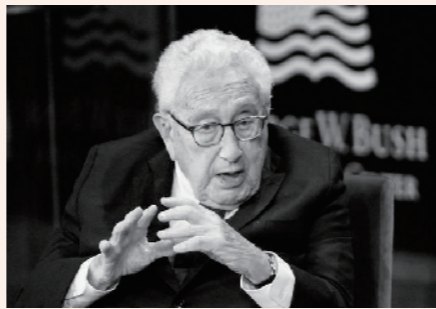
美国前国务卿亨利·基辛格(资料图片)

当地时间11月29日,美国前国务卿亨利·基辛格逝世,享年100岁。1971年7月,时任美国总统尼克松国家安全事务助理的基辛格作为总统特使访问中国,为启动中美关系正常化进程作出了历史性贡献。次年2月,基辛格陪同尼克松总统访华。今年7月,已经100岁的基辛格又一次访问中国。他一生中访问中国一百多次。