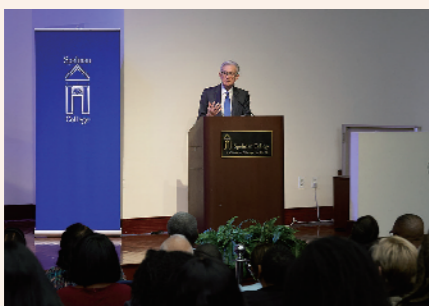
12月1日,鲍威尔在佐治亚州亚特兰大斯派尔曼学院发表讲话。(资料图片)

美联储2022年3月启动本轮加息周期,累计加息幅度为525个基点。加息节奏上,单次加息由25个基点逐步提高至75个基点,并在75个基点的水平上连续加息4次,为近40年来最快加息速度。