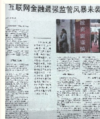
《互联网金融最强监管风暴来袭》