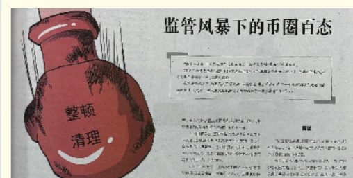
《监管风暴下的币圈百态》