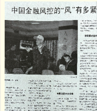
《中国金融风控的“风”有多紧》