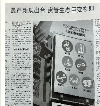
《最严新规出台 资管生态巨变在即》