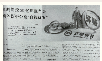
《红岭创投50亿坏账当头 购入新平台欲“曲线备案”》