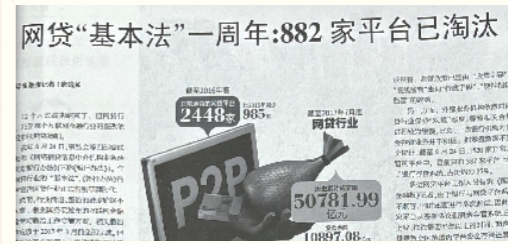
《网贷“基本法”一周年:882家平台已淘汰》